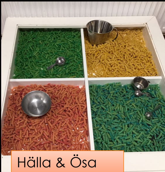
Hälla & Ösa